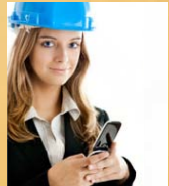
Recebimento de SMS em caso de parada de operação

*Capacidade de remoção de água - consulte nosso departamento técnico