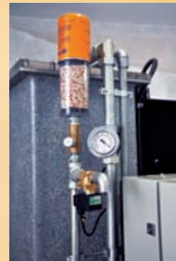
Injeção de ar seco e quebra automática do vácuo